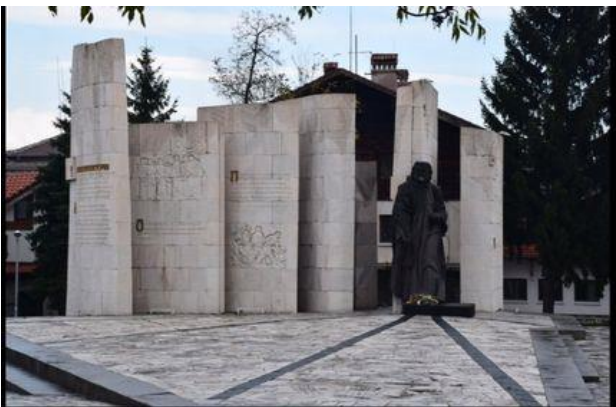
Паметникът на Паисий Хилендарски в Банско

Ако си успял да вдъхновиш някого, да го накараш да задвижи цялата си енергия, да си постави по-високи цели, да постигне нови неща, то ти безспорно си будител.