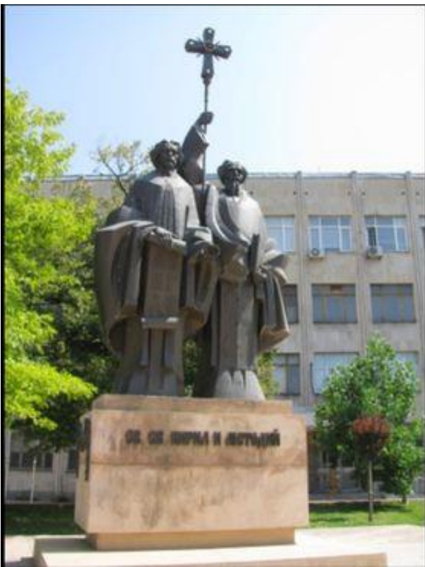
Паметникът на братята Св .Кирил и Методий

”Тоз, който падне в бой за свобода, той не умира!“