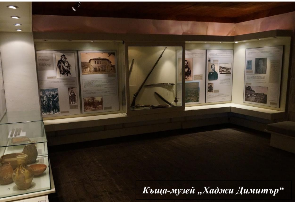
Къща-музей „Хаджи Димитър“

До последния му дъх го помня такъв борбен и решителен. Когато акостирахме на българския бряг в местността Янково гърло край свищовското селце Вардим, усещах напрежение. Осъзнавах сериозността на задачата, пред която бяхме изправени. Осъзнаваше я и моят скъп приятел. Показа се юнак и този път, но такава му била орисията – да пожертва себе си в името на свободата. Оказа се, че от самото начало четата била забелязана от турски патрул и след нея е била изпратена потеря. Това разбрах много след това, когато попаднах в дома на Селим чауша, откъдето времето ме покри с пурпура на забравата до момента, в който две чисти ръце ме положиха в тази прозрачна витрина до фотографията на моя войвода. За малко да заплача от щастие, но на нас – пищовите, не ни е позволено.